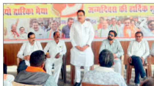
द्वारकाधीश यादव की अध्यक्षता में हुई बैठक

खल्लारी विधायक द्वारकाधीश यादव ने संगठन को मजबूत बनाने तथा विभिन्न पदों पर नियुक्ति को लेकर विस्तृत चर्चा की गई। साथ ही इच्छुक कार्यकर्ताओं से दायेंदारी भी आमंत्रित की गई। बैठक में उपस्थित कार्यकर्ताओं ने संगठन को और अधिक सशक्त बनाने का संकल्प लिया। ब्लॉक कांग्रेस