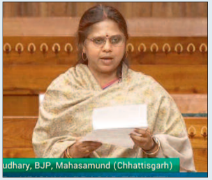
Usha Chaudhary, B.J.P. Member of Parliament, Mahasamund (Chhattisgarh)

नई स्वीकृति के तहत विकसित होने वाला रिंग टोपोलॉजी आधारित नेटवर्क अधिक विश्वसनीय और सुरक्षित माना जाता है। इस प्रणाली में यदि किसी एक लिंक पर नेटवर्क बाधित होता है तो इंटरनेट सेवा वैकल्पिक मार्ग से जारी रहती है, जिससे कनेक्टिविटी बाधित नहीं होती। परियोजना के क्रियान्वयन से ग्रामीण क्षेत्रों में ई-गवर्नेंस सेवाओं, ऑनलाइन शिक्षा, टेलीमैडिसिन और डिजिटल आर्थिक गतिविधियों को गति मिलने की संभावना है। इससे ग्राम पंचायतों, स्कूलों, स्वास्थ्य केंद्रों और ग्रामीण समुदायों को बेहतर डिजिटल सेवाएं उपलब्ध हो सकेंगी।