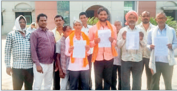
तीन माह बाद भी कार्रवाई नहीं