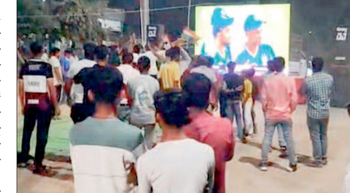
व्यवस्था साप्ताहिक बाजार के पास की थी। पूरा नगर सायं 7 बजे के पहले स्क्रीन के समक्ष आ बैठा मैच के दौरान

फाइनल मैच में भारत ने न्यूजीलैंड को 96 रनों से परास्त कर टी 20 का खिताब तो जीता ही है। साथ ही भारतीय टीम तीसरी बार विश्व चैंपियन बनी। जीत व चैंपियन बनने की देहरी खुशी में युवाओं ने एक दूसरे को खूब रंग गुलाल लगाया और मध्य रात्रि डीजे की धुन पर थिरकते नजर आये। वहीं देर रात तक पटाखे फोड़ कर खूब आतिशबाजी भी की गई।