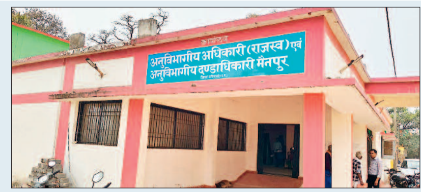
स्थायी एसडीएम की तत्काल नियुक्ति हो

के कार्य को लेकर ग्रामीण एसडीएम कार्यालय पहुंच रहे हैं लेकिन एसडीएम उपस्थित नहीं होने के कारण